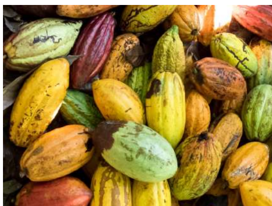
BIO Kakao aus Peru

Was gibt es im Winter Besseres, als sich gemütlich zuhause mit einem Heißgetränk aufzuwärmen? Wir finden: gar nichts!